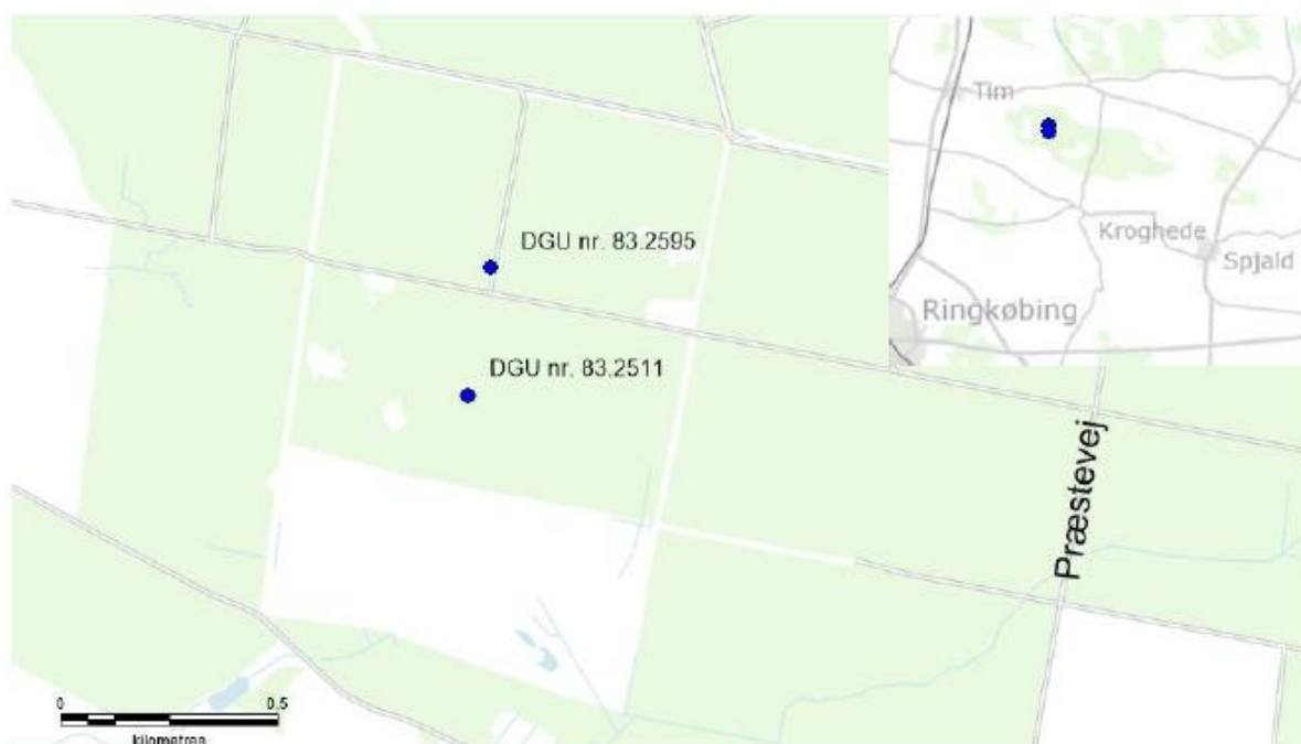
Figur 3-1: Oversigtskort, med placering af de nye borer.